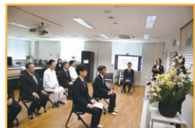
緊張と期待が入り混じった雰囲気