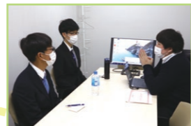
アイフーズについての説明を受ける様子