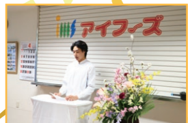
先輩社員からの祝辞