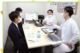
レクリエーションの様子