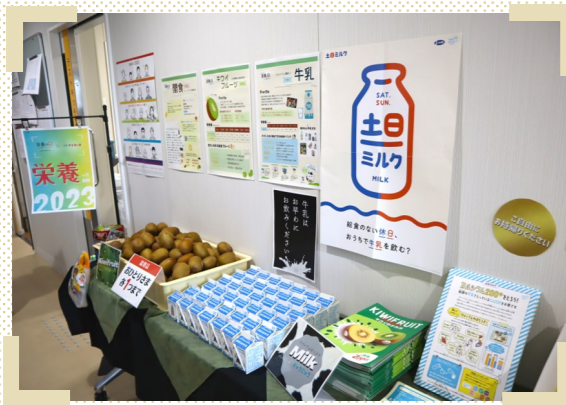
掲示物や配布物が廊下にズラリ