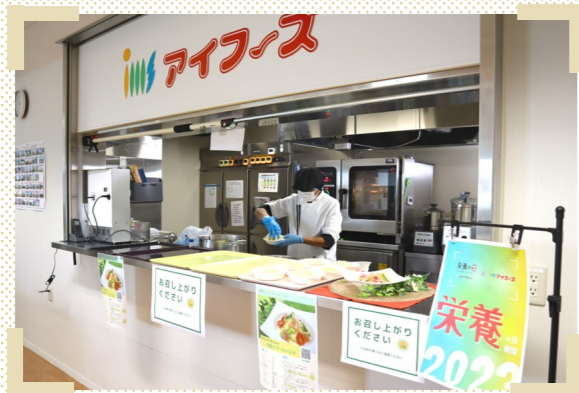
社内テストキッチンから出来立てをご提供