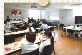
部屋の仕切りを取って提供スペース拡大