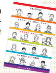
栄養士会発行のポスター

その他、リーフレットや協賛品のキウイフルーツ・牛乳、オリジナルレシピカードを配布し、従業員が休み時間等に足を止めて眺めたり歓談する様子も見受けられ、 楽しんで栄養を学ぶ ことができました！