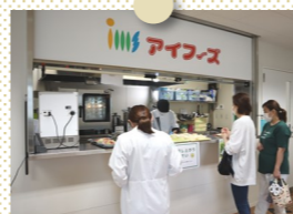
テストキッチンの前は人だかりが…!