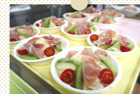
華やかな盛り付けが食欲をそそります