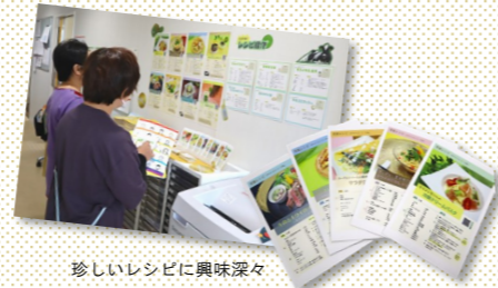
珍しいレシピに興味深々

(公社)日本栄養士会では8月4日を「 栄養の日 」、8月1日～7日を「 栄養週間 」と定めて、毎年様々な取り組みを行っています。アイフーズでは今回、社内で「 栄養の日 」のイベントを開催しました！同イベントの様子や、社員考案のレシピをご紹介します。